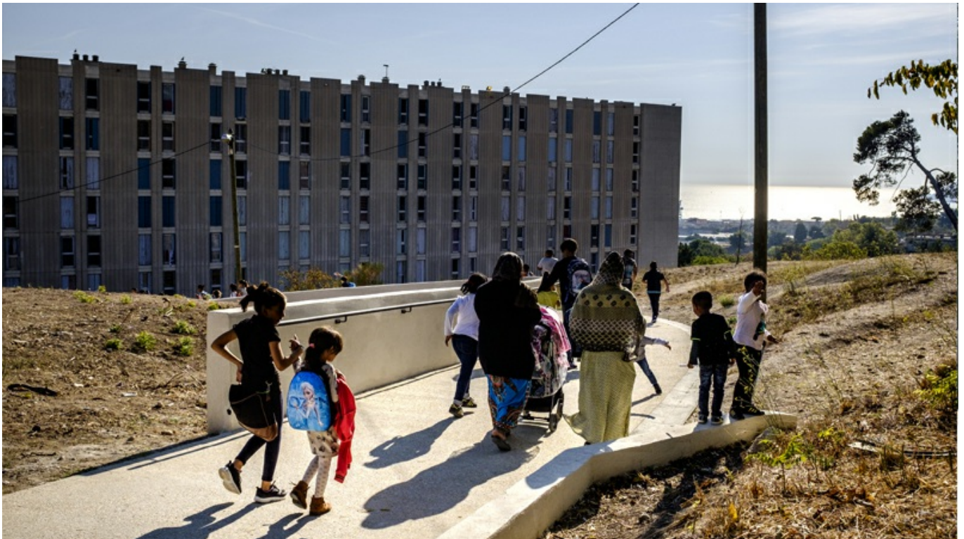
Le chemin de l'école de la Jougarelle à la Castellane

Trois territoires de projets en rénovation éducatives ». Une méthode et un cœur des projets de renouvellement