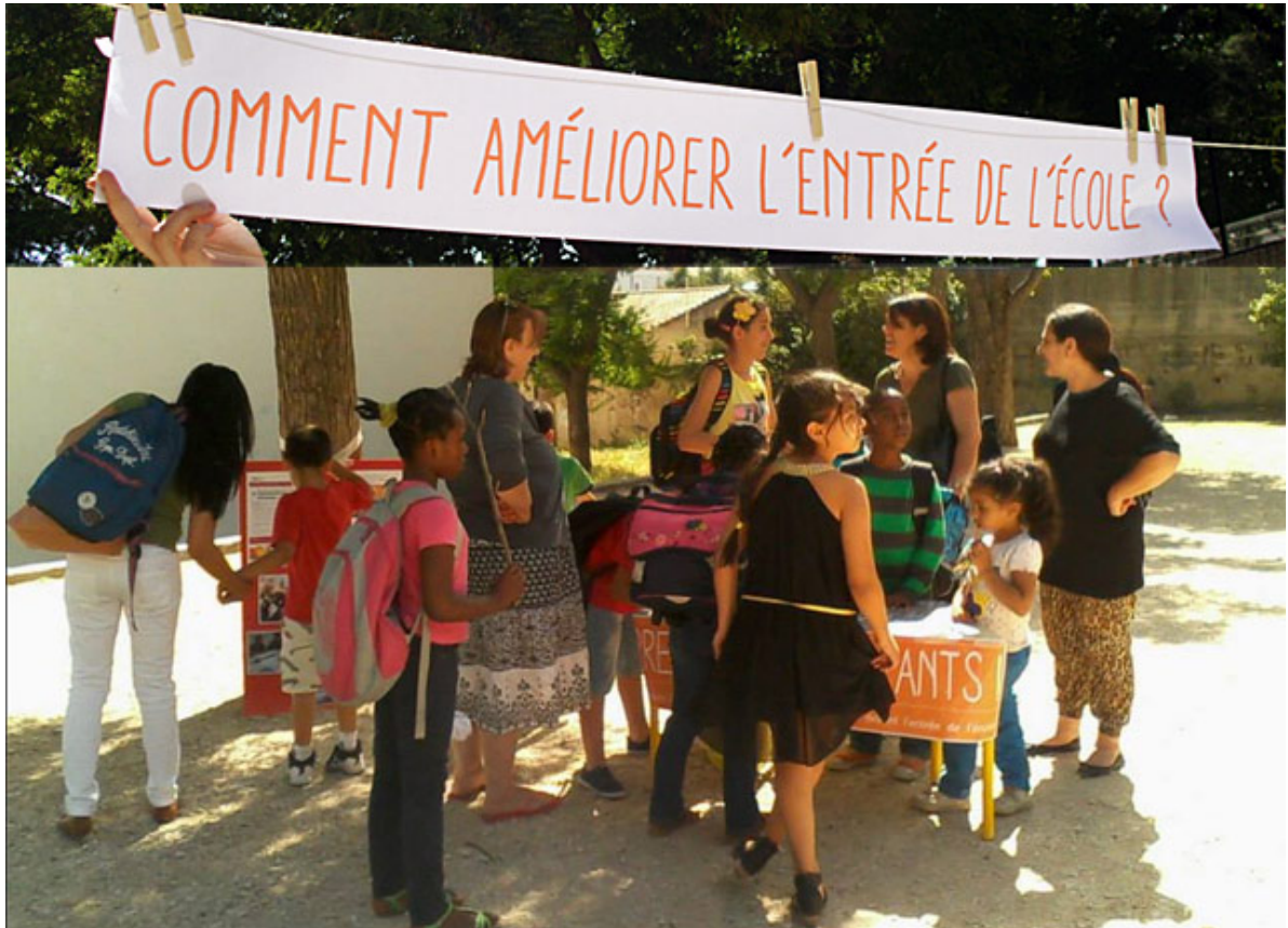
Jun 2014 - animation d'ateliers pour les parents, enfants, enseignants et personnel scolaire

P r é s e n t a t i o n d e s r é s u l t a t s d e l a (