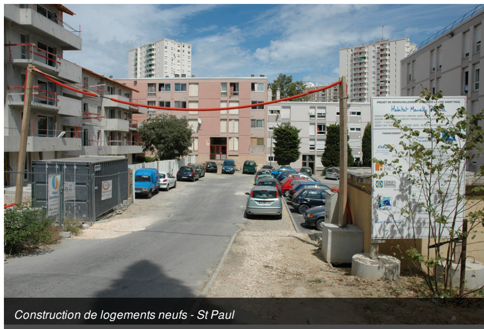
Construction de logements neufs - St Paul