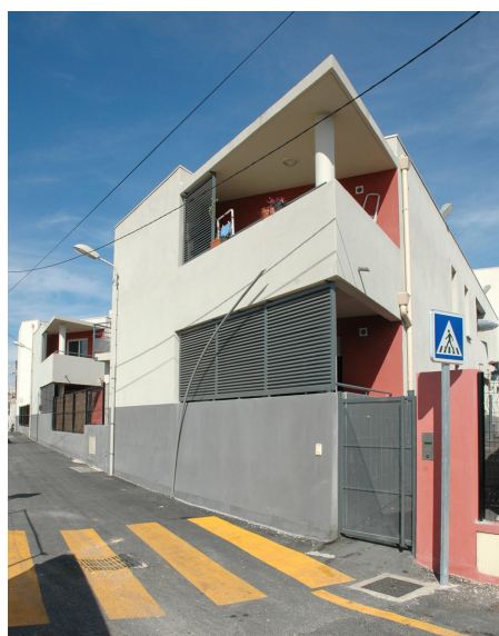
Résidence Gaillard - Nouveau Logis Provençal - Opération de Résorption de l'Habitat Insalubre de la Ville de Marseille