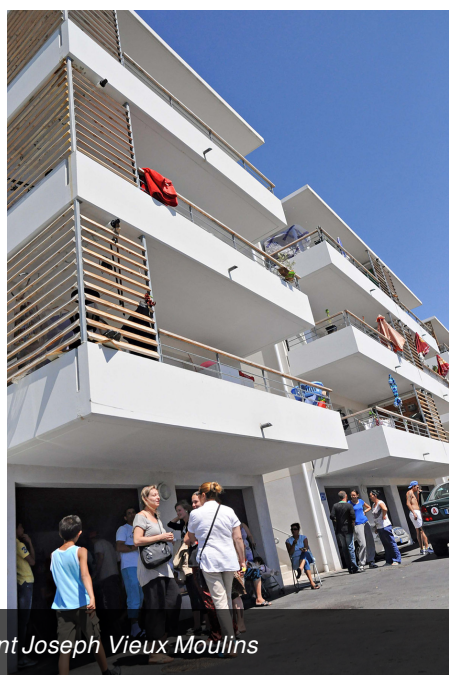
Logements neufs - Saint Joseph Vieux Moulins