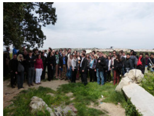
Visite des équipes du concours European sur le site de Plan d'Aou - avr 2013