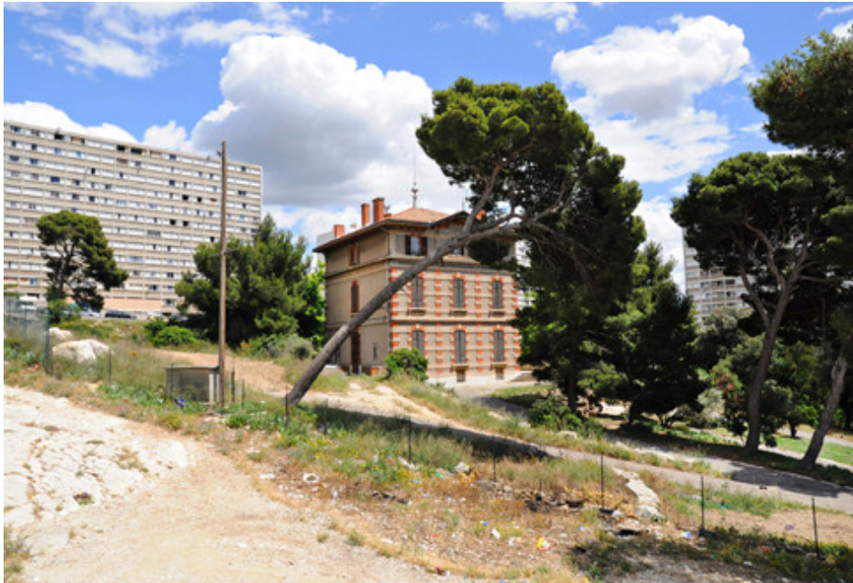
Château en santé au coeur du parc Kallisté