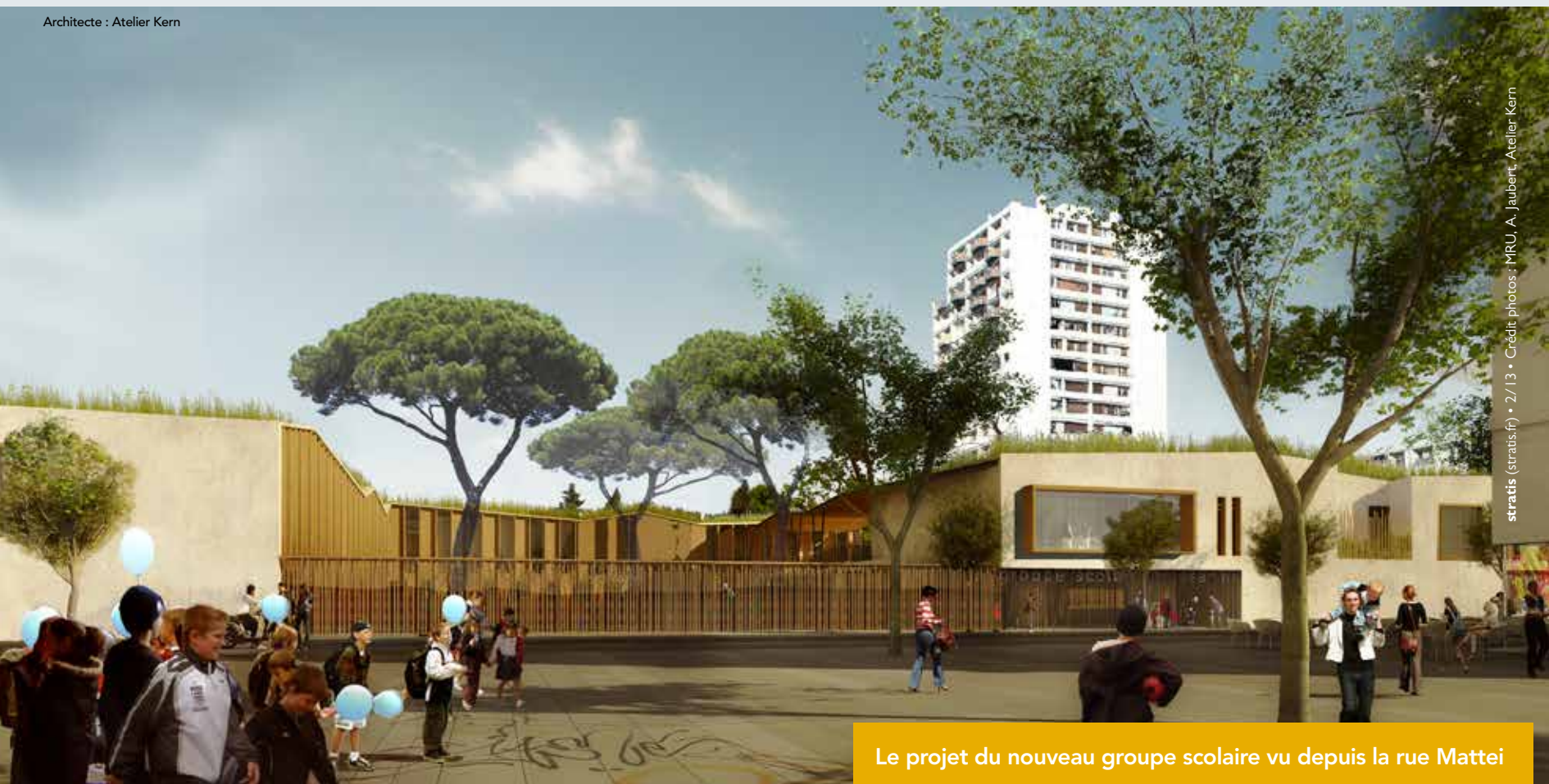
Le projet du nouveau groupe scolaire vu depuis la rue Mattéi